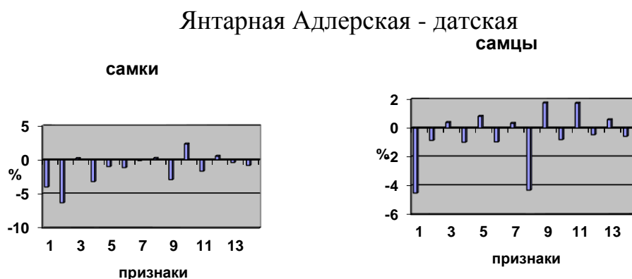
Рисунок 2 – Отличия морфометрических признаков белорусских популяций форели от литературных данных (1 – длина туловища, 2 – длина рыла, 3 – диаметр глаза, 4 – длина головы, 5 – длина хвостового стебля, 6 – высота головы у затылка, 6 – наибольшая высота тела, 7 – наименьшая высота тела, 8 – наибольший обхват тела, 9 – наименьший обхват тела, 10 – толщина тела, 11 – толщина головы, 12 – толщина головы, 13 – толщина хвостового стебля, 14 – ширина лба).

Сравнение морфометрических показателей, популяций янтарной Адлерской форели и форели датского происхождения сформированных в республике, указывает на некоторые их различия (рисунок 2).